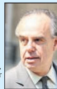
(MATHIEU DE MARTIGNAC)

L A VILLE de Nanterre aurait peu de chances d'être finalement retenue par le ministre de la Culture, Frédéric Mitterrand, pour accueillir les réserves du Louvre. Le terrain des Groues, proche de La Défense, proposé par la mairie, présenterait, en effet, un inconvénient de taille pour l'Etat : il est cerné par les voies SNCF. Les 6 ha disponibles n'offrent aucune possibilité d'extension à terme, ce qui handicaperait le projet. Les deux autres candidatures de Neuilly-sur-Mame (93) et Cergy (95) ne présentent pas les mêmes contraintes.