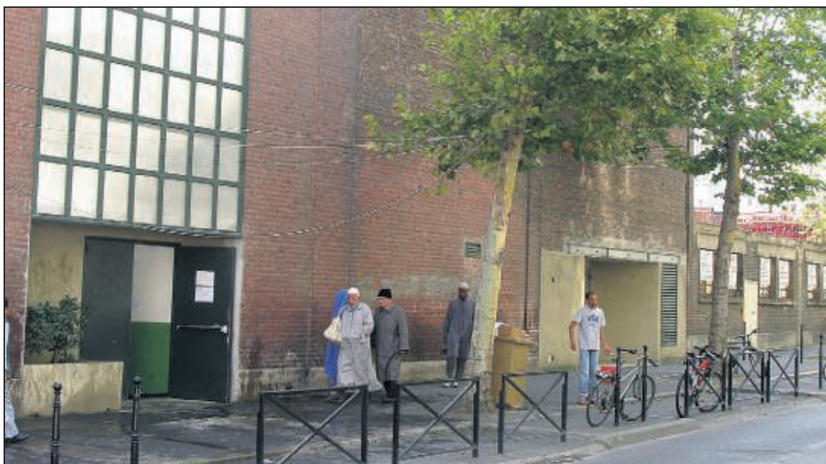
BOULOGNE-BILLANCOURT, LE 11 SEPTEMBRE. L'actuelle mosquée est située au 53, rue Yves-Kermen. Le projet d'un bâtiment de cinq étages sur 700 m 2 piétine.

Et en la matière, comme souvent, le projet piétine. Le bâtiment — cinq étages sur 700 m 2 — est chiffré à 4,5 millions d'euros. Pour l'instant, les fidèles qui arpègent inlassablement les marchés boulonnais depuis plus de deux ans ont récolté environ un million d'euros. Mais une manne venue de l'étranger, du gouvernement d'Arabie saoudite plus précisément, pourrait bien débloquent la situation. « L'ambassadeur à Paris a reçu une demande de subvention qu'il observe avec intérêt », assure un proche du dossier. Abdes-