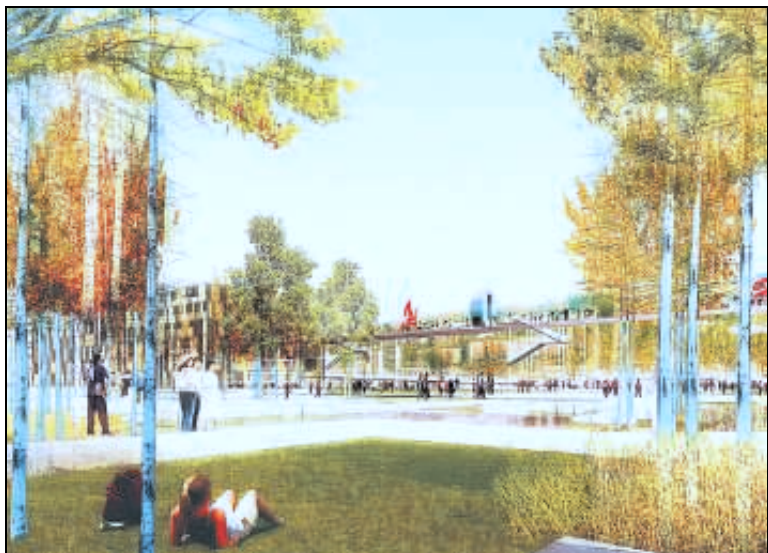
Des jardins devraient voir le jour sur l'île. Mais sur quelle surface ?